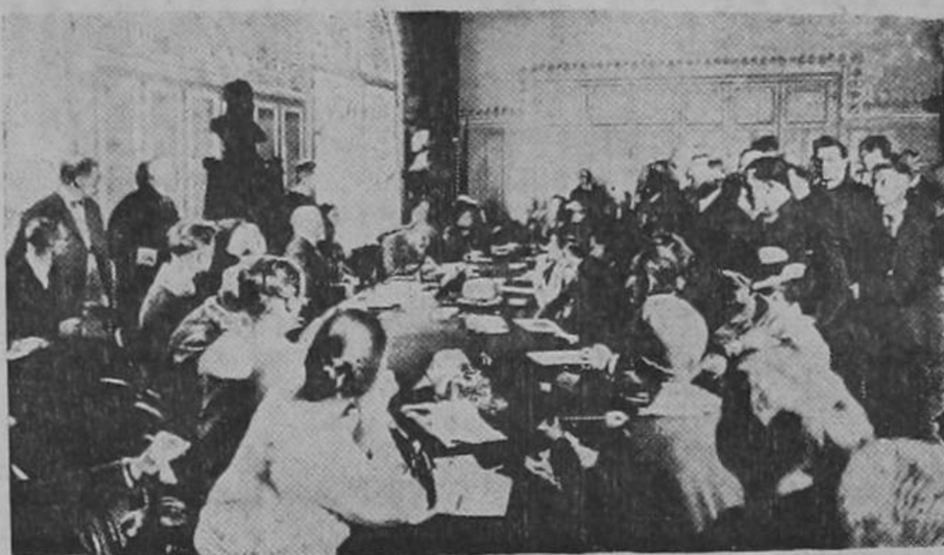
Durante una sesión del Congreso de la Paz, en el anfiteatro de la Sorbona, en Paris